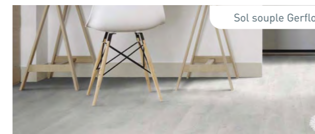
Sol souple Gerflor